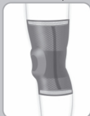
Бандаж на коленный сустав